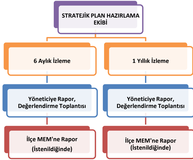
Tablo 26: İzleme ve Değerlendirme Şablonu

Yıllık planın uygulanmasında yürütme ekipleri ve eylem sorumlularıyla aylık ilerleme toplantıları yapılacaktır. Toplantıda bir önceki ayda yapılanlar ve bir sonraki ayda yapılacaklar görüşülüp karara bağlanacaktır.